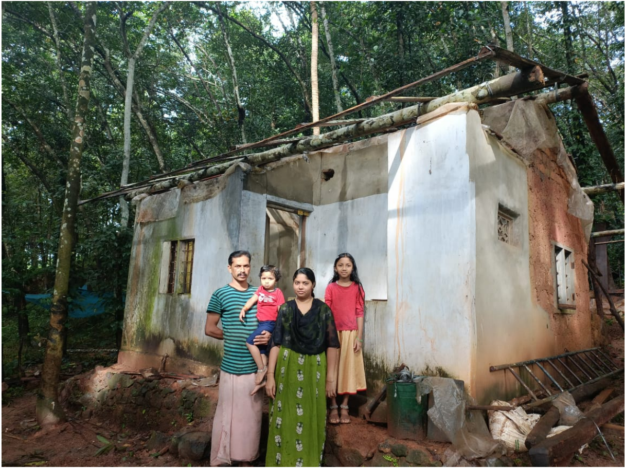
Dieses Lehm Haus der Hindufamilie wurde von dem Taifun zerstört.